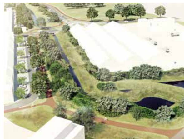
Een nieuwe aankomst voor Terhagen

We vernieuwen ook de Crequilei. Er komen tientallen parkeerplaatsen en een ecobuffer bij. Zo krijgt Terhagen een heel nieuwe aanblik.